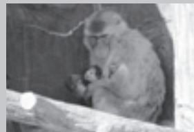
ニホンザル 5月3日、5月8日、19日、6月2日(4頭)