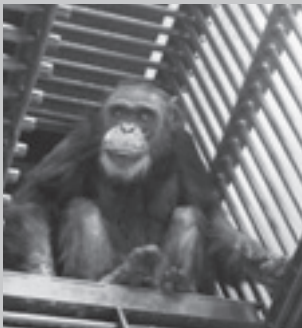
チンパンジー 「ゆみのすけ」(オス)