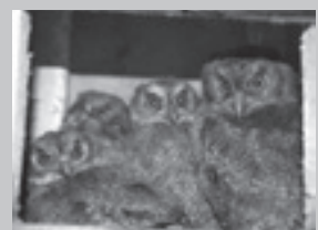
オオコノハズク 5月31日(2羽)、6月2日(2羽)