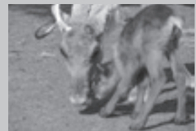
トナカイ 5月7日、10日、14日、15日、19日、31日、6月1日(7頭)