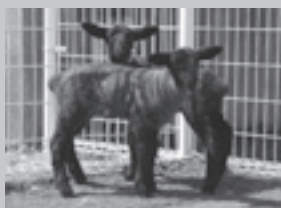
メンヨウ 4月15日(双子、2頭)